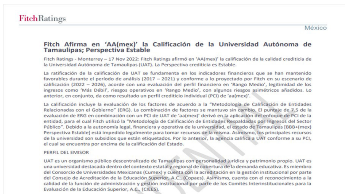
Figura 3. Reporte de la calificadora Fitch Rating, sobre la calidad crediticia de la UAT

En el caso de ambas calificadoras S&P Global y Fitch Rating, toma como insumo para su calificación, los estados financieros de la institución, presupuestos de ingresos y egresos, estados financieros trimestrales públicos, información de sistemas de pensiones, estadísticas comparativas, entre otros.