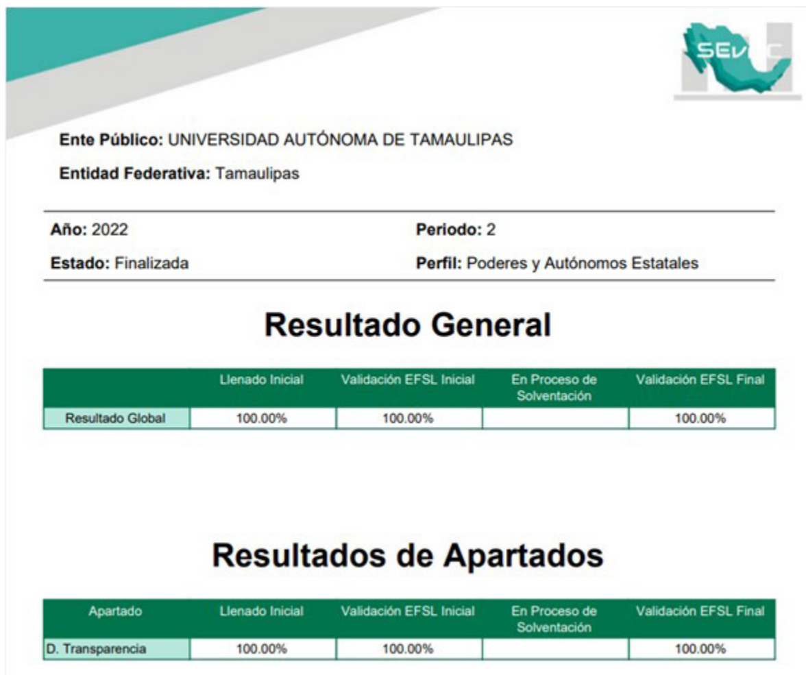
Figura 1. Reporte del Sistema de Evaluaciones de la Armonización Contable (SEVAC)