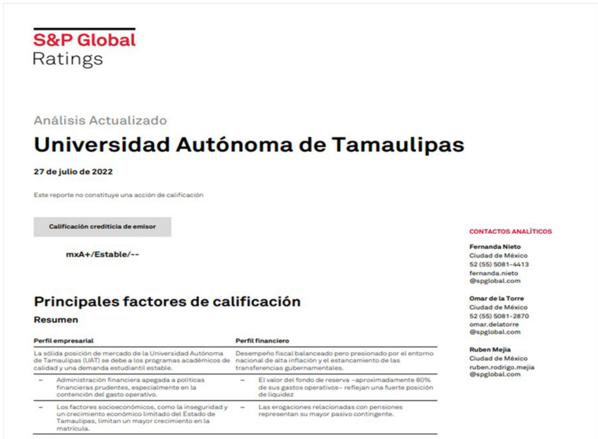
Figura 2. Reporte de la calificadora S&P Global Rating, sobre la calidad crediticia de la UAT